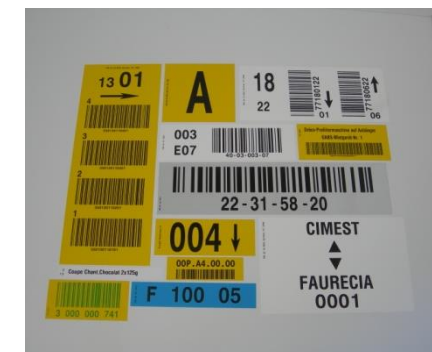
Types d'étiquettes avec code à barres