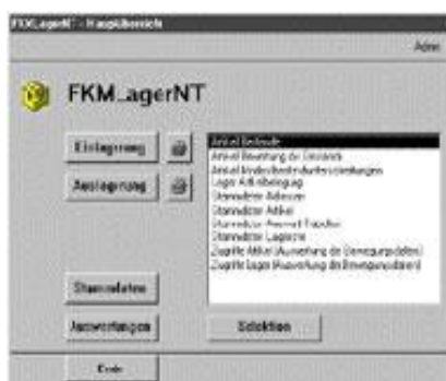
Impression écran système