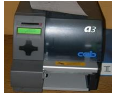
Impression des données