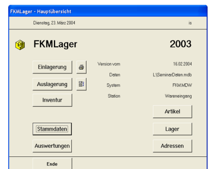
Impression écran démarrage logiciel