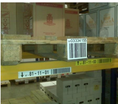
Étiquettes avec code à barres