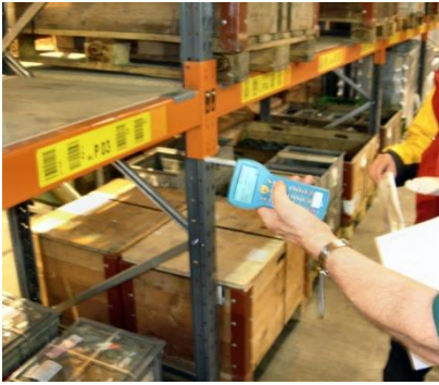
Piccolink en application