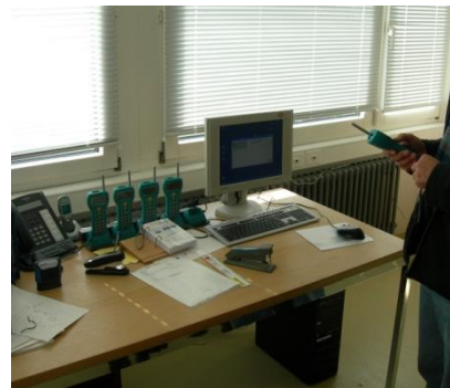
Poste de travail en bureau