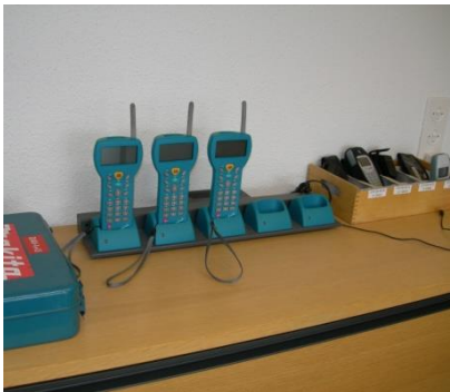
Poste de travail