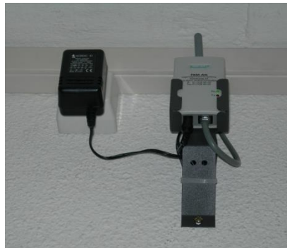
Récepteur radio pour Piccolink