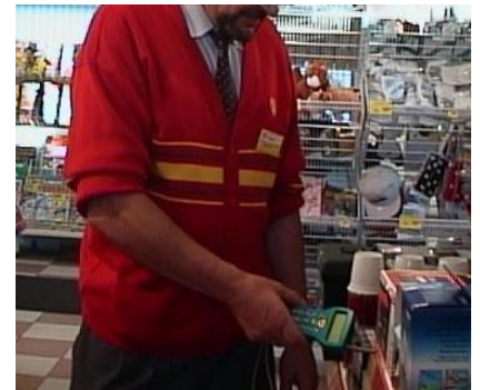
Piccolink en application