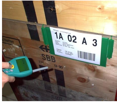
Piccolink en application