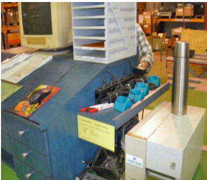
Poste de travail en entrepôt