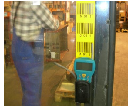
Système de rangement pour Piccolink